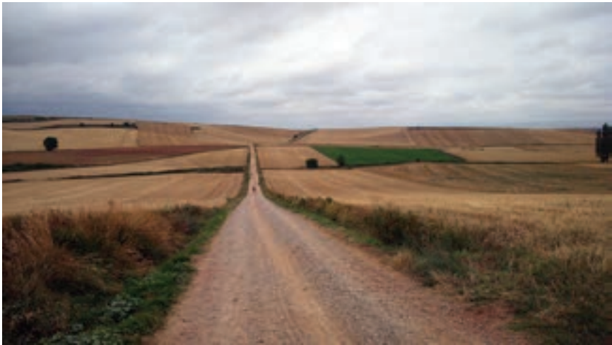
Prema Santo Domingu de la Calzadi

i umiješanih strana, računajući i promatrače. Na jednoj strani kršćanska pobjeda, koja je odjeknula Europom i zaustavila prodiranje islama s europskog zapada, to jest izbacila ga. S druge strane, prekogibraltarski ekstremisti ni dandanas ne žele se odreći aspiracija prema Španjolskoj kao potencijalnom islamskom teritoriju. Zvoni u ušima još uvijek ne tako davna, ona poznata rečenica marokanskog kralja Hasana II., koji je prije tridesetak godina pojasnio da je „Maroko stablo koje ima korijenje u Africi, ali čije se grane šire u Europi.” A Židovi? Židovi i dalje u svojim pismima, knjigama, možda i pjesmama, osjećaju bol i tugu zbog svih onih progona koje su doživjeli u Europi posljednjih petsto godina i koji su tragično kulminirali holokaustom u dvadesetom stoljeću, iako je baš pripadnik njihova, židovskog naroda, Sveti Jakov Zebedejev, utirao put poganima s Pireneja nepovratno prema Kristu, ucijepivši i te narode, kao grane, u veliko Kristovo stablo na zemlji.