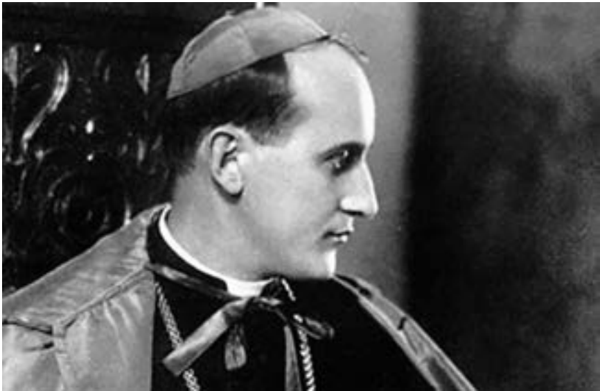
Kardinal Alojzije Stepinac nadbiskup zagrebački mučenik i blaženik (naslovnica brošure)

Budimo zahvalni i Kardinalu koji se potpuno darovao Bogu, a time i svome hrvatskom narodu i cijeloj Crkvi Božjoj.”