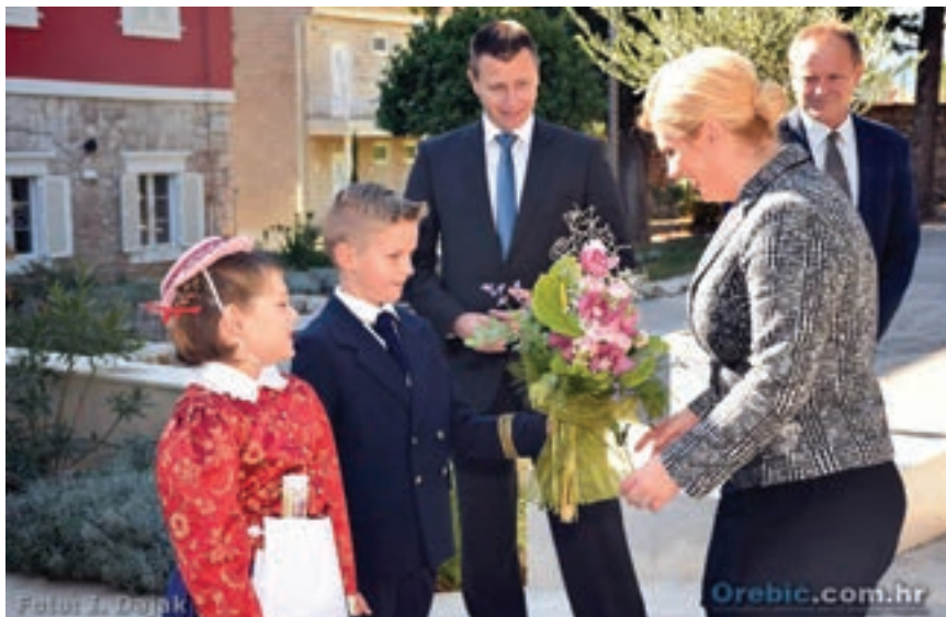
Predsjednica Republike Hrvatske Kolinda Grabar Kitarović u posjetu Općini Orebić

26. listopada 2017. godine našu je Općinu posjetila predsjednica Republike Hrvatske Kolinda Grabar Kitarović. Ovaj se posjet odvijao u sklopu aktivnosti Dubrovačko-neretvanske županije u kojoj je taj tjedan radio Ured Predsjednice.