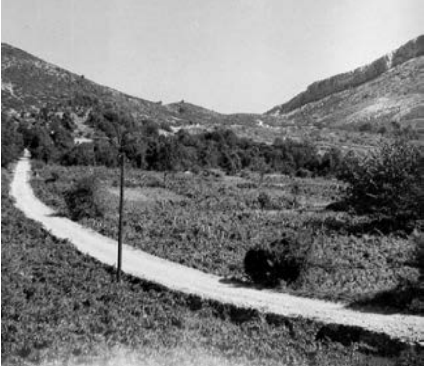
Put kroz Pijavičino 1953.

Takodjer se pozivlju Upravitelji Šumarija da upozore sve lugarasko osoblje na pojačanu pažnju na terenu, jer neposredno predstoji proslava 29. novembra, te je lugarsko osoblje dužno da svako branje zelenila na području državnih šuma, tretira kao i svaku drugu šumsku štetu i da o tome podnosi odgovarajuće prijave protiv krivaca...” 24 .