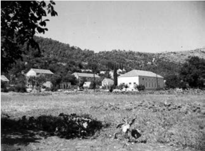
Potomje 1953.

Moram priznati da mi je ona starija pisana građa mnogo interesantnija od ove novije (otrag 65 godina), ali život piše svoje priče ne osvrćući se na režime ili državni ustoj. Sudionici događanja koja se donose u nastavku vjerojatno su se preselili na onaj svijet i neka im je pokoj vječni, a živima Bog da zdravlja.