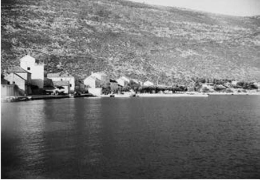
Trpanj 1953.

Ovo je potrebno što prije učiniti kako bi se radi nastale vrućine što prije spriječilo i uništilo razmnožavanje bakterija raznih bolesti.