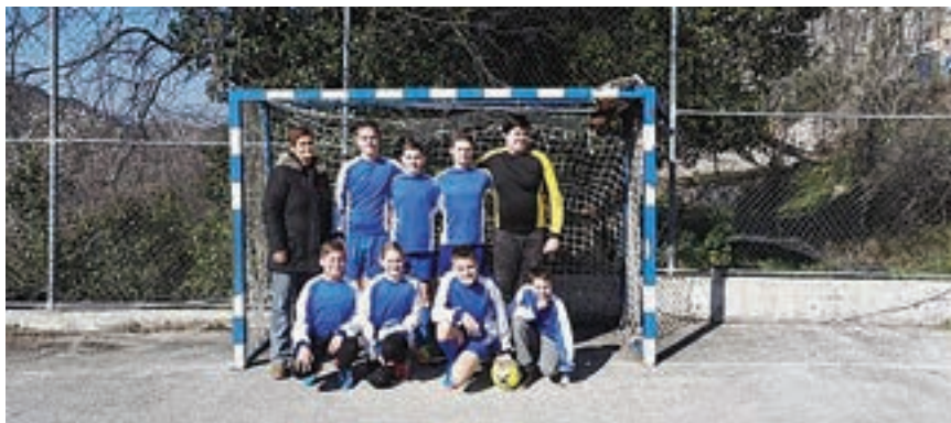
Futsal momčad OŠ „Kuna“

Svim čitateljima Zvona Delorite učenici i djelatnici OŠ „Kuna“ žele sretan Uskrs!