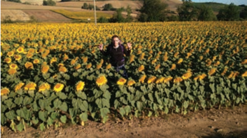
Hodočasnik sa suncokretima

snom i njegov narod odgurala barem sljedeće stoljeće u neželjenu javu, trajno mu ranivši samopouzdanje.