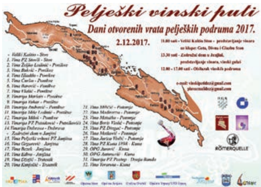
Plakat Peljeških vinskih puta