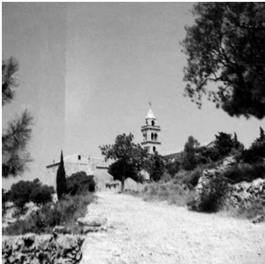
Samostan Gospe od Loreta i stari put prema Potomju 1953.