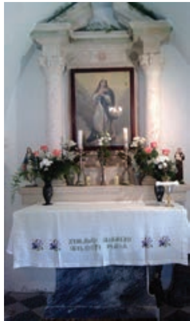
Restaurirana slika na oltaru